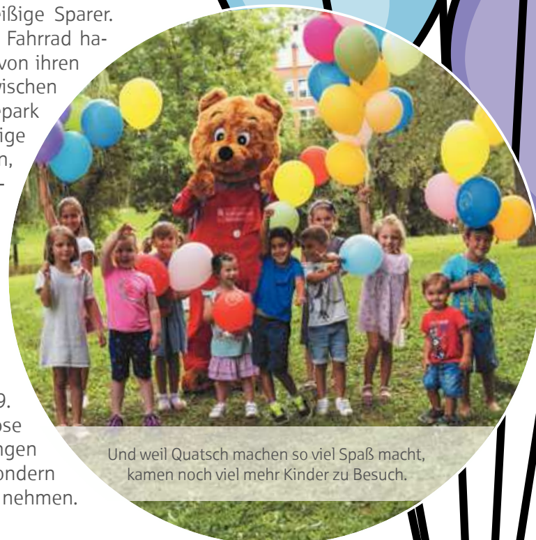
Und weil Quatsch machen so viel Spaß macht, kamen noch viel mehr Kinder zu Besuch.

Der erste Schritt: Zum Weltspartag am 29. Oktober wird sie den Inhalt ihrer Spardose auf ihr Konto der Kreissparkasse Tübingen bringen und damit nicht nur Sparen sondern auch ein tolles Geschenk in Empfang nehmen.