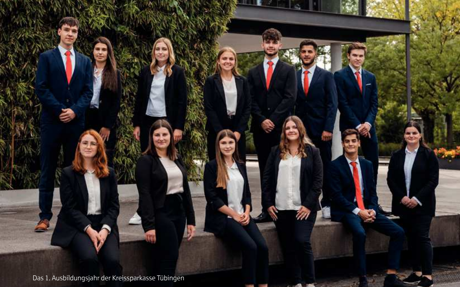
Das 1. Ausbildungsjahr der Kreissparkasse Tübingen