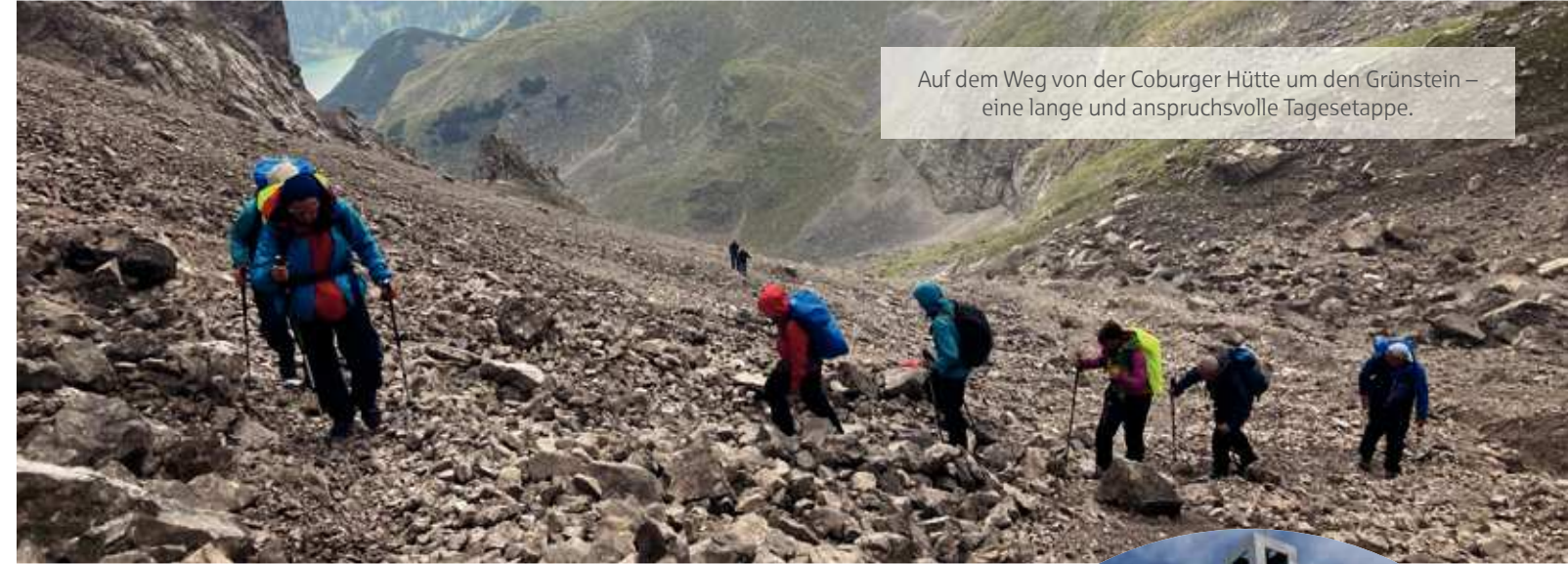
Auf dem Weg von der Coburger Hütte um den Grünstein – eine lange und anspruchsvolle Tagesetappe.